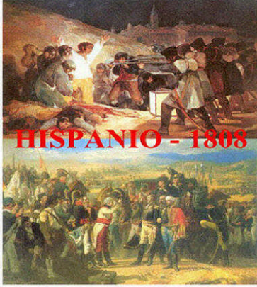
La 2a de majo en Madrido