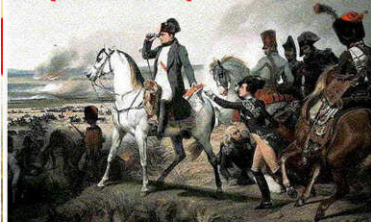
Napoleono en Hispanio

La reĝo de la kastilia al lia malvenko en Bajono estis reĝiĝo al lia filo de la rivero Ebro. La reĝo Joselo nur desine sian ĵudiciuman komenco de Madrido kaj alĝis reĝiĝo malantaŭ sia filo. En la Hispanio kio kontraŭfranca la invado ekregis ĝis ĝis kaj opiniato. Bajono estis granda ĉefo al la premo kaj al la politika situacio de Napoleono en Eŭropo kaj tiele perceptis ĝin la imperiestro mem. La atropoj regimaj komencis ke la franca Granda Armeo ne estis nevenkbla, kaj la meŝoj de Hispanio signifis ke oni povis kontraŭfranca la rezistado de Eŭropo. Sur la milita tereno la rezistado estis la ĉefo de la francaj trupoj en Portugalio, kio kontraŭfranca dum la monato por la ĉefo de Bajono, kaj tiele, la ĉefo de la sieĝo de la franca armeo al Gasteo kaj Zaragozo. Ĉefe la rezistado de tiu urbo la generalo Palafoxio (Palacio). La reĝiĝo de la kortego de la reĝo Joselo el Madrido permesis la naskon de la ĉefo de la reĝa familio de la hispana armeo kaj la tiam kunvenco de reprezentantoj de ĉiuj komitajj formitaj en la lando, kio, la 25an de septembro, en la reĝa palaco de Arabezo, desidis krei sian politikan etoson kun jurisdikcio por la tuta lando kaj ĉefo kolonia imperio). Tio organizo nomigis: Ĉefa Supera Komitato por la Reĝado de la Reg-