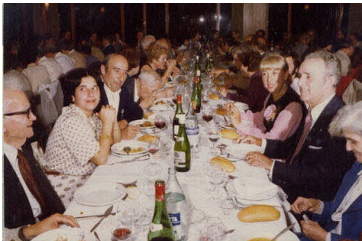
En la kongresa bankedo